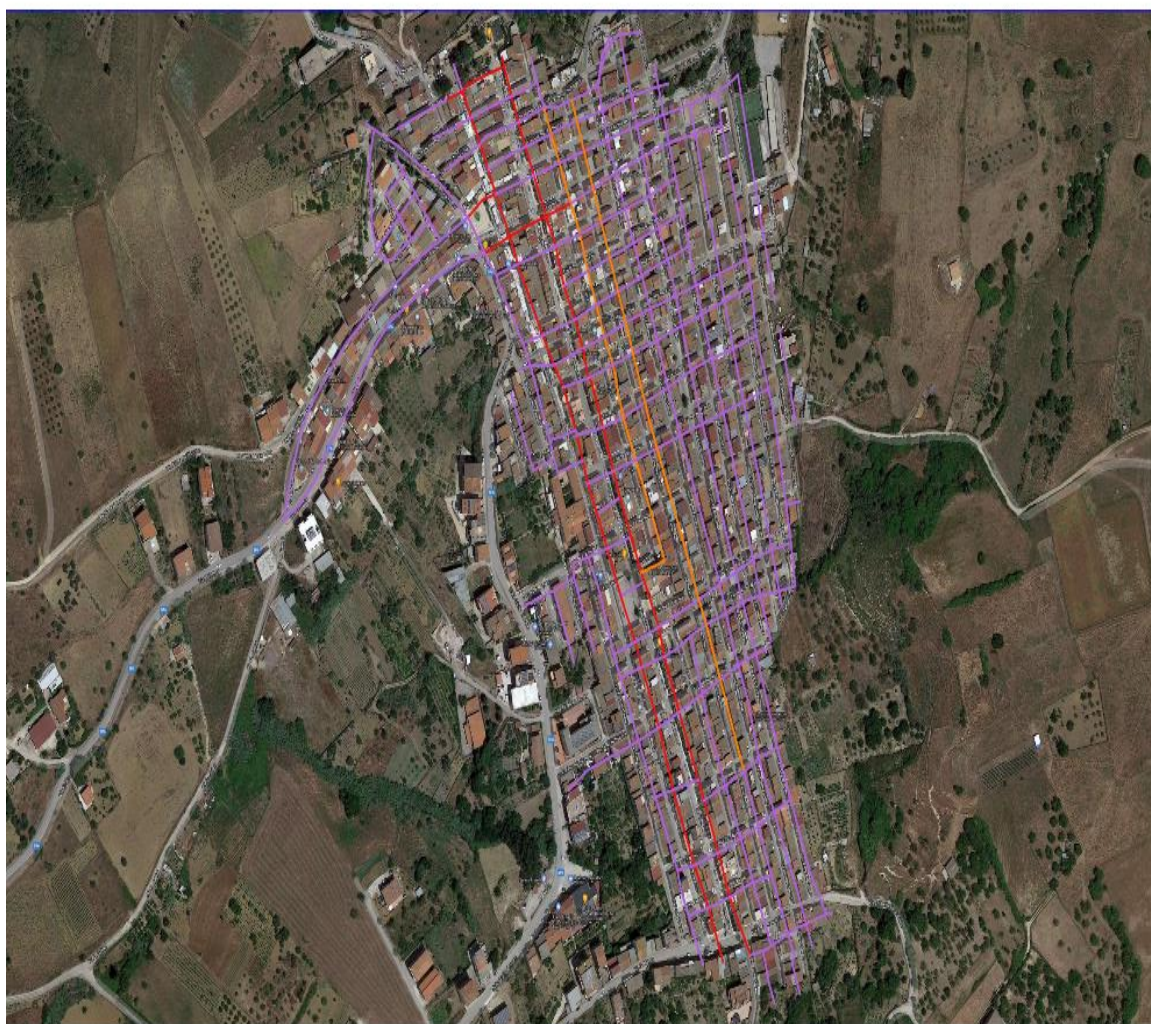
Perimetri Spazzamento Manuale Baucina